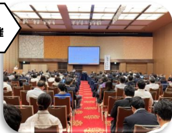
<令和5年度定時総会の様子>