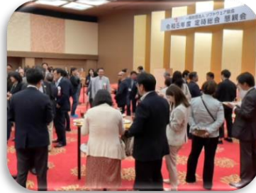
＜会場内の懇談の様子＞