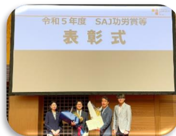
<総会後の表彰式の様子>