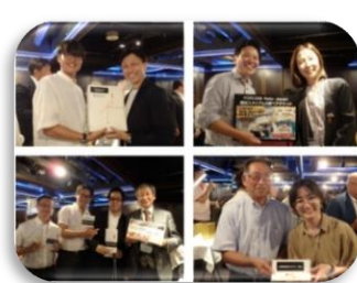
＜豪華賞品をゲットした皆様＞

SAJ 理事や会員企業参加者との名刺交換で人脈を拡大。豪華景品を提供して自社をアピール（じゃんけん大会に参加することもできます）。参加して豪華賞品をゲット!・・・など楽しさも盛りだくさんです。