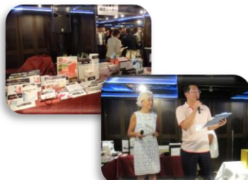
＜抽選会・じゃんけん大会＞